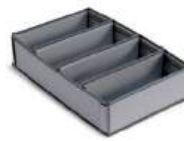
Separador Magic Hotel