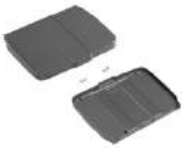
Tapa soporte de bolsa 120 L con tabla porta notas