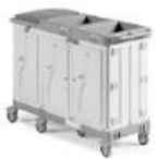
Magic Hotel 840E