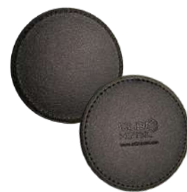
CB1313 10 cm x 0,5 cm