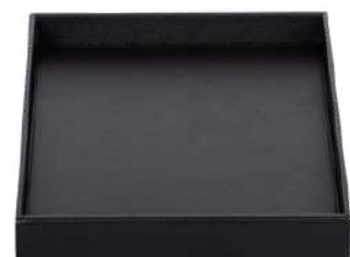
CB1317 35 x 35 x 5 cm