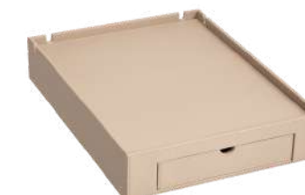
CB1328B 31,5 x 41,5 x 7,8 cm