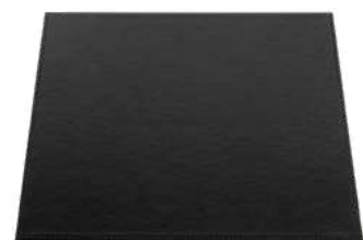
CB1311 32 x 32 x 0,8 cm