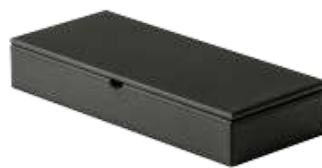
506332 35 x 15 x 4 cm