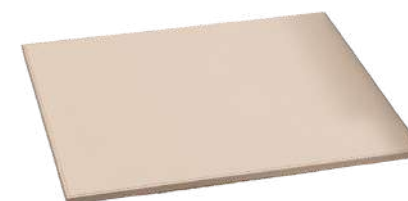
CB1311B 32 x 32 x 0,8 cm