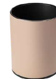
CB2843B 25 x 32cm