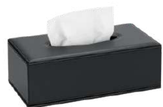
CB1014P 25,2 x 13,7 x 8,5 cm