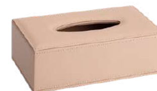
CB1014B 25,2 x 13,7 x 8,5 cm