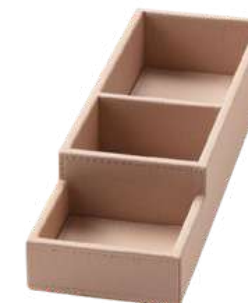
CB1312B 9,7 x 32 x 5,5 cm