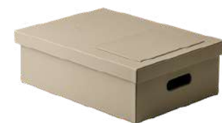
506343 28 x 40 x 16 cm