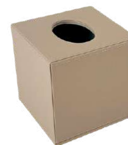
506336 13,5 x 13,5 x 14 cm