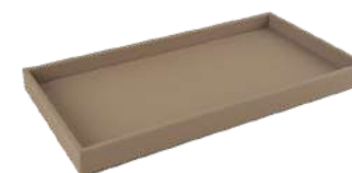
506338 40 x 20 x 3 cm