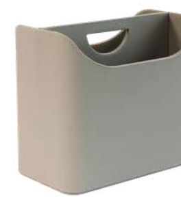
506342 17 x 27 x 28,5 cm