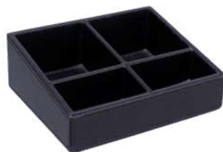
CB1318 16 x 13 x 6 cm