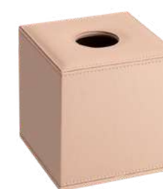
CB1013B 14 x 14 x 14,5 cm