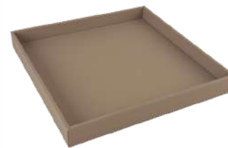
506339 35 x 35 x 5 cm