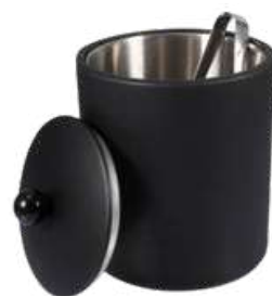
CB1341P 13,6 x 18,5 cm