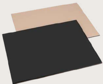
CB1314 50 x 40 x 0,8 cm