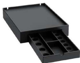
CB1328 31,5 x 41,5 x 7,8 cm