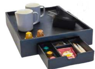
506324XL 33,5 x 40,5 x 8 cm