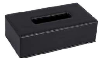
CB1014 25 x 13,5 x 8,5 cm