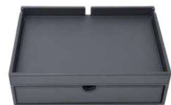
CB1309P 26,5 x 19 x 8,4 cm