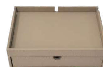
CB1309B 26,5 x 19 x 8,4 cm