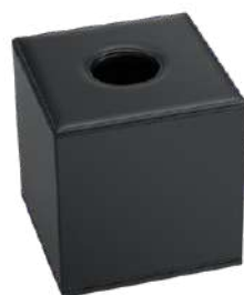
CB1013P 14 x 14 x 14,5 cm