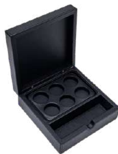
CB1429P 17 x 17 x 6,5 cm