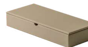
506345 35 x 15 x 4 cm