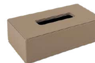
506335 25 x 13,5 x 8,5 cm