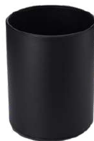
CB2843P 25 x 32cm