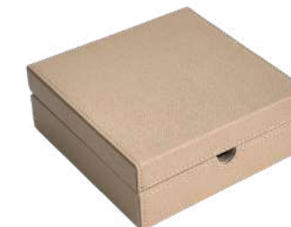
CB1429B 17 x 17 x 6,5 cm