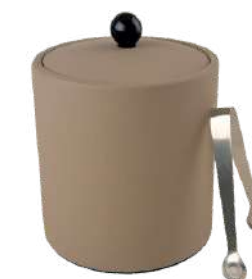
506340 14 x 14 x 18 cm