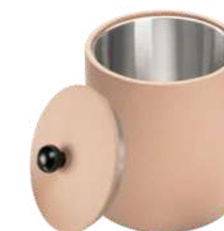
CB1341B 13,6 x 18,5 cm