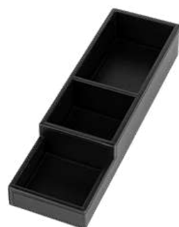
CB1312 9,7 x 32 x 5,5 cm