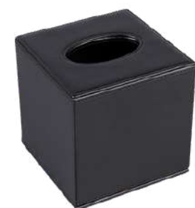
CB1013 13,5 x 13,5 x 14 cm