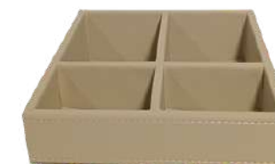
CB1318B 16 x 13 x 6 cm