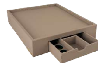
506341XL 33,5 x 40,5 x 8 cm